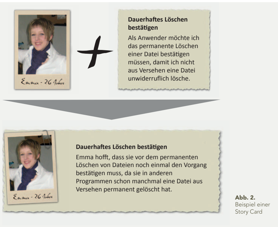
Abb. 2. Beispiel einer Story Card

Rolle im jeweiligen Kontext) und seinen Anforderungen (z. B. „Als Anwender möchte ich...“) (Wirdemann 2009, Nazzaro & Suscheck 2010). Dieses Verfahren sollte beim konsequenten Einsatz von Personas in allen Projektschichten dahingehend geändert werden, dass auch an dieser Stelle die Personas eingesetzt werden (z. B. „Emma möchte...“). Durch diesen Einsatz der Persona erscheint der Anwender nicht mehr als Abstraktion (Beyer 2010).